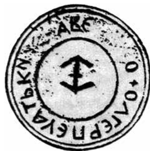
Печать Великого князя Литовского Ольгерда