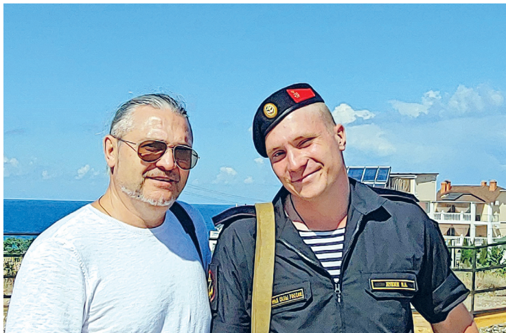
День Присяги – 02.08.2020. Севастополь, музейный историко-мемориальный комплекс «35-я береговая батарея» в Казачьей бухте